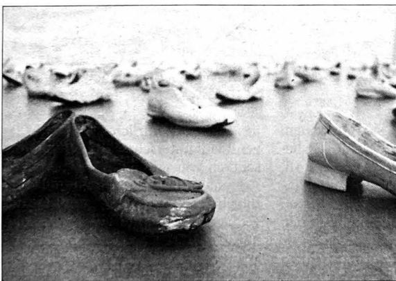
Eine grossflächige Installation von Marianne Kuster im Danioth-Pavillon.